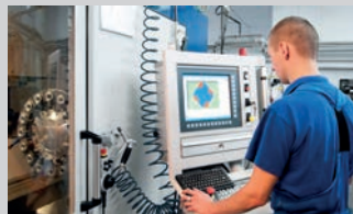
Maschinen- und Anlagen- führer Schwerpunkt Metall- und Kunststofftechnik (m/w/d) | 7