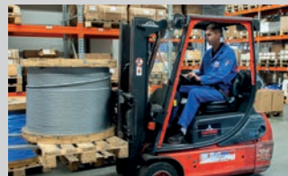
Fachkraft für Lagerlogistik (m/w/d) | 8