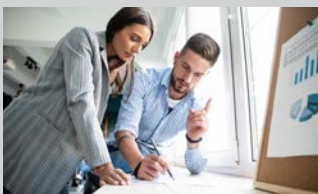
Bereich BWL - Fachrichtung Marketing Management (m/w/d) | 18