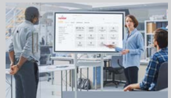
Bereich BWL Fachrichtung Digital Business Management (m/w/d) | 17