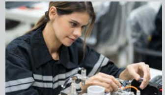
Mechatroniker (m/w/d) | 13