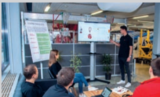
Bereich BWL - Fachrichtung Industrie (m/w/d) | 14