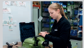
Industriemechaniker (m/w/d) | 9