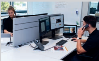
Industriekaufmann (m/w/d) | 6