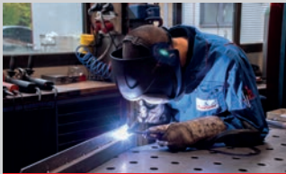
Metallbauer Fachrichtung Konstruktionstechnik (m/w/d) | 10