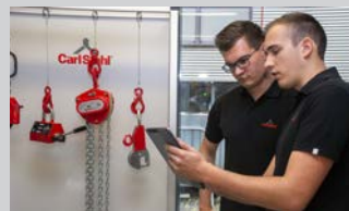
Bereich Maschinenbau - Fachrichtung Konstruktion und Entwicklung (m/w/d) | 16