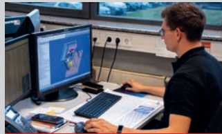
Technischer Produktdesi- gner Fachrichtung Maschinen- und Anlagen- konstruktion (m/w/d) | 11