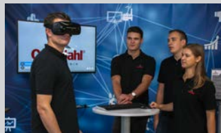
Bereich Wirtschaftsinge- nieurwesen - Fachrichtung Innovations- und Produkt- management (m/w/d) | 15