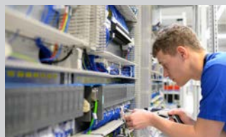
Bereich Mechatronik (m/w/d) | 19